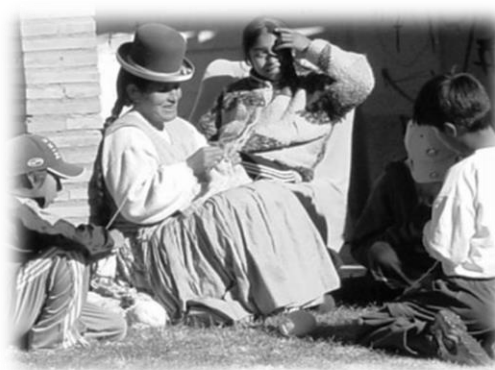
Colegio Kurmi Wasi, Achocalla, La Paz, Bolivia.

Esta educación integraba lo que hoy frecuentemente intentamos ver separadamente: « Pensar, sentir y hacer para ser »