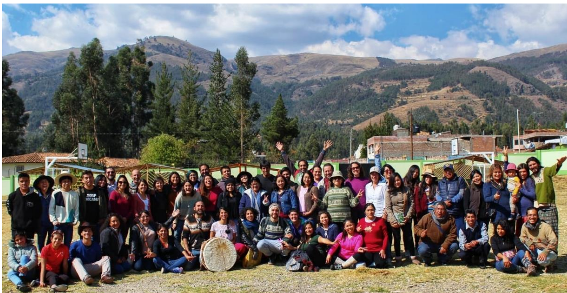
Foto: Encuentro Nacional Kuska Risunchis 2019 en San Pedro de Saño (Huancayo)

Para conocer diversas experiencias educativas nacionales, inspirarse y reflexionar juntos sobre preguntas como: ¿Qué educacion(es) necesita el Perú? invito a participar en los encuentros nacionales Kuska Risunchis organizados cada año por un colectivo muy diverso, desde 2013.